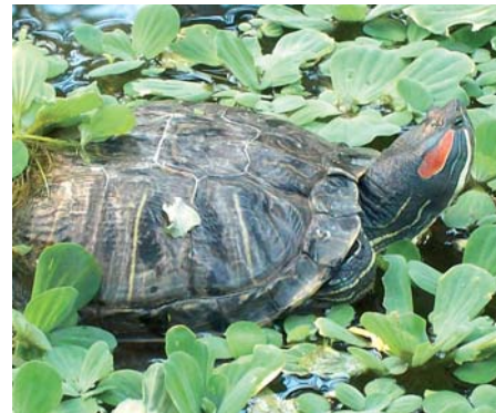
Die Rotwangenschildkröte gehört zu den invasiven Neozoen. Ausgesetzte Exemplare vermehren sich und bedrohen heimische Arten. Der Handel mit dieser Schildkröte wurde deshalb EU-weit verboten.

riges Kreuzkraut, Breitblättriger Ampfer usw.) Die Tier-, Pflanzen- und Pilzwelt in unserem Land ist in ständigem Wandel. Die Verbreitung von Arten verändert sich und passt sich neuen Verhältnissen an. Mit dem weltweiten Handel und der globalen Mobilität transportiert der Mensch vermehrt Arten über natürliche Verbreitungsgrenzen hinweg.