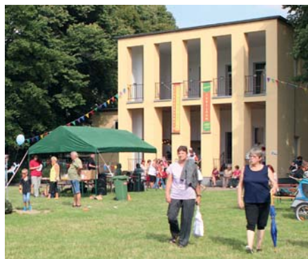
Das größte Schreberheim Deutschlands (hier ein Foto von 2017) wurde umgebaut und wird als Kindertagesstätte im besten Schreibersinn genutzt.

Die 1930er Jahre brachten auch für den „Schreberverein der Ostvorstadt“ grundlegende Veränderungen. Ab Mai 1933 gab es einen Vereinsführer. Der Name wurde in „Kleingärtnerverein der Ostvorstadt“ geändert. Ende 1933 zählte der Verein 452 Mitglieder.