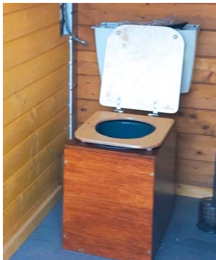
Der Spülkasten hat dank Trenntoilette ausgedient.

tenhäuschen aufgestellt. Als Frau war ich vor allem neugierig, was die Nutzung angeht, da der Trenneinsatz ja fest installiert ist. Nach eingehender Nutzung muss ich sagen, dass ich mir