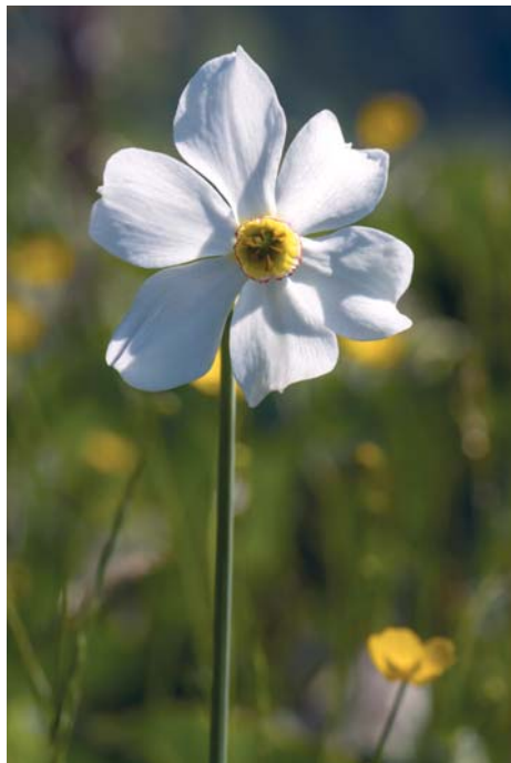
Zu den bekanntesten Arten zählt die Weiße oder Dichter-Narzisse.

Sie ist auch die Blume des Versprechens. Wenn es die Burschen ernst meinen, überreichen sie ihrer Auserwählten einen Strauß weißer Narzissen.