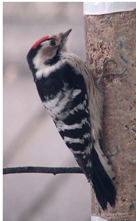
Der Kleinspecht (hier an einer Futterstelle fotografiert) ist ein Indikator für einen hohen Anteil an Totholz und Urwaldstrukturen.

Seltener finden wir in Zentraleuropa den Mittelspecht vor. Die nach EU-Vogelschutzrichtlinie streng geschützte Vogelart ist in ihrem Bruthabitat stark an grobborkige Bäume und „Störstellen“ an Bäumen gebunden. Waren diese Bedingungen ursprünglich in Urwäldern der Zerfallsphase vorhanden, findet man sie für den Mittelspecht heute in erster Linie noch in älteren Eichenwäldern, Hartholzauen und artenreichen Laubmischwäldern mit großräumigem oder lückigen Bestand. In den Klüften und Rissen der rauen Borke sucht der auch als Stocherspecht bezeichnete Vogel mit seinem pinzettartigen Schnabel nach Insekten und Spinnen.