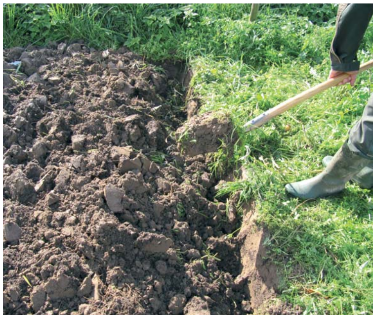
Das Umgraben mit dem Spaten ist ein Klassiker der Gartenarbeit, aber nicht immer die beste Form der Bodenbearbeitung.

Zu häufiges Umgraben (also vor allem jährliches) ist für das Bodenleben in den Beeten nicht gut. Man muss den Boden bzw. die Bodenstruktur als