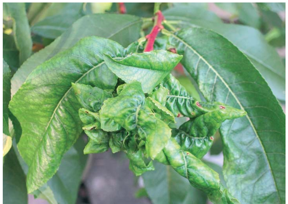
Das Schadbild der Kräuselkrankheit an einem Pfirsichbaum.